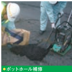
●ポットホール補修