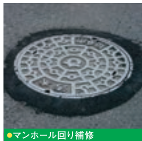
●マンホール回り補修