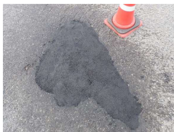
ポットホール補修