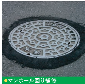
●マンホール回り補修