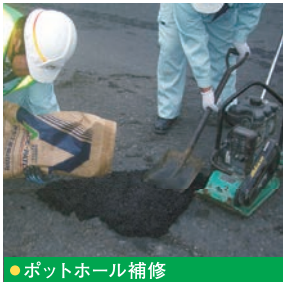
●ポットホール補修